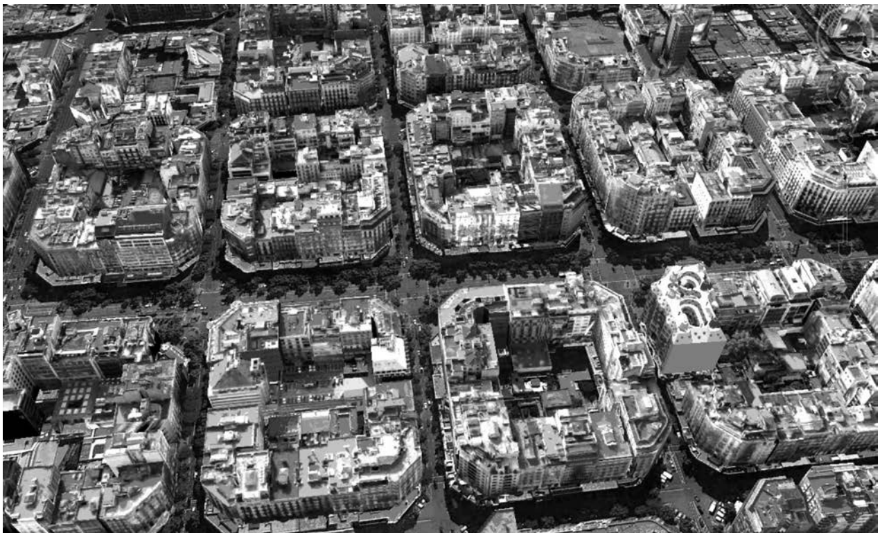
Imagen oblicua de un sector del núcleo urbano de Barcelona (2018)

La congestión del tráfico y los problemas de movilidad y de contaminación del aire que se derivan son uno de los retos más importantes que se plantean en las grandes ciudades. Por eso muchas de ellas están desarrollando planes de movilidad urbana con el principal objetivo de reducir el uso del transporte privado.