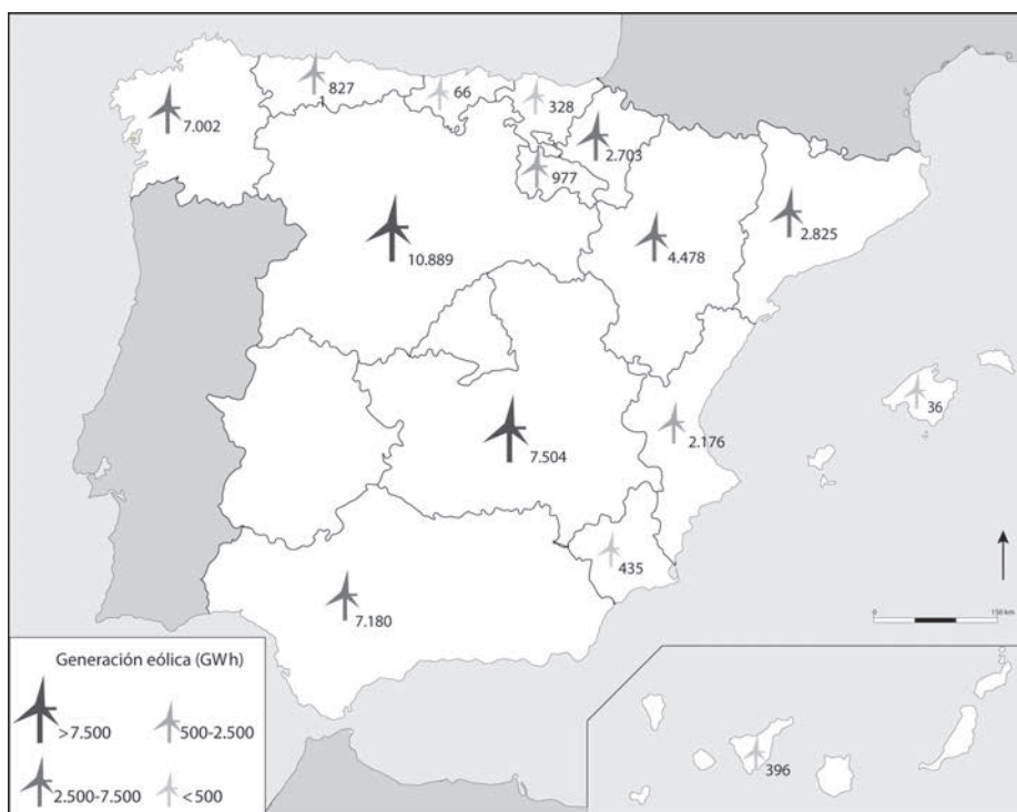
La energía eólica en España