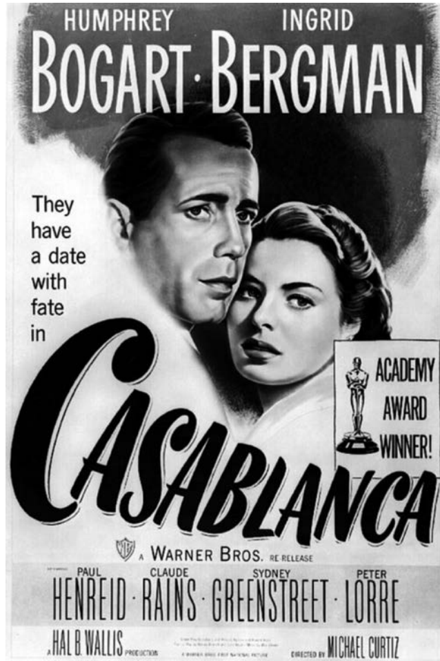
Cartel de Casablanca (1942), de Michael Curtiz.

Observe atentamente el siguiente cartel de la película Casablanca (1942), de Michael Curtiz, y responda a las cuestiones 2.1, 2.2 y 2.3.