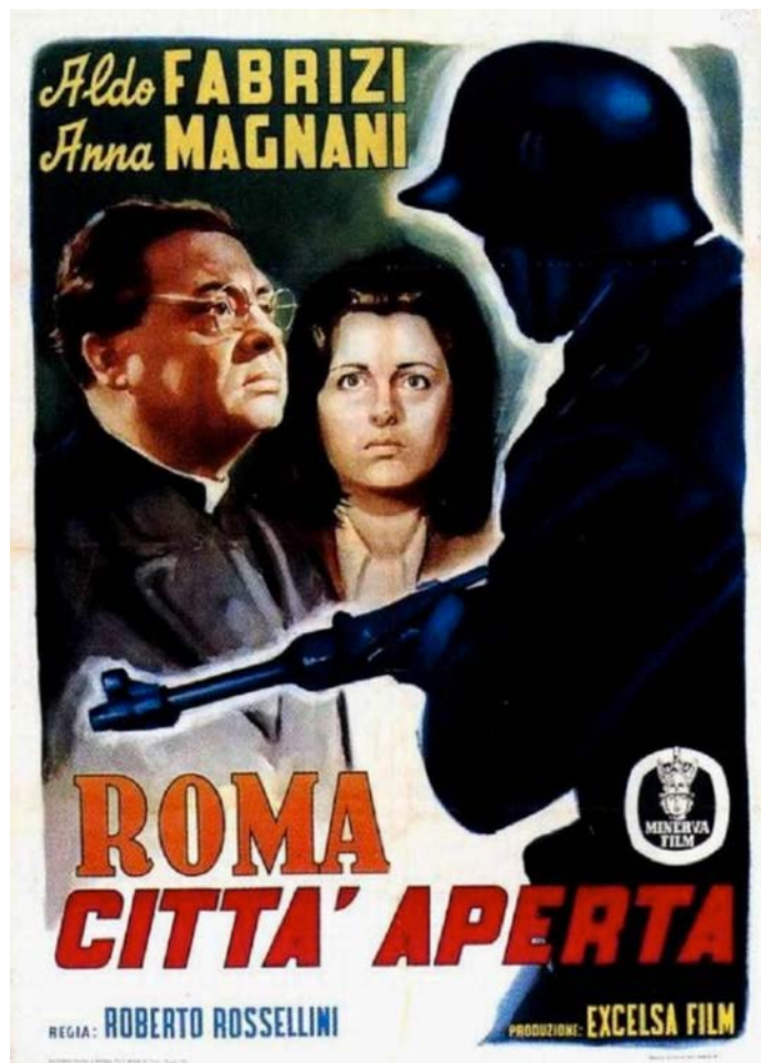
Cartel de Roma, ciudad abierta (1945), de Roberto Rossellini.

Observe atentamente el siguiente cartel de la película Roma, ciudad abierta (1945), de Roberto Rossellini, y responda a las cuestiones 2.1, 2.2 y 2.3.