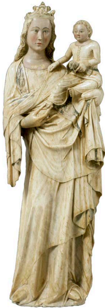
OBRA 2. Virgen con el Niño de Sallent de Sanaiüja (Segarra).

a) Sitúe la obra en su contexto cronológico, histórico y cultural.