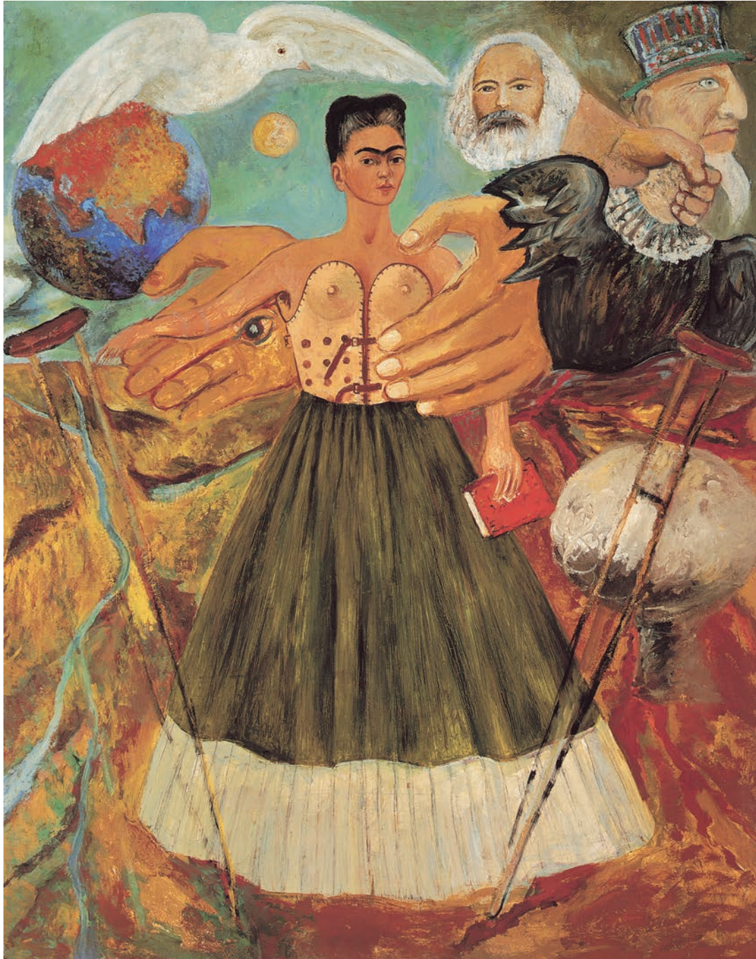
El marxismo dará salud a los enfermos , de Frida Kahlo