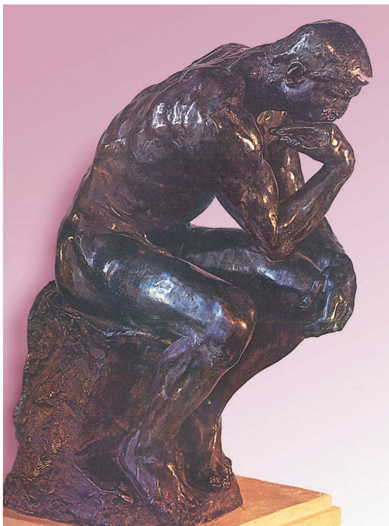
El pensador , de François-Auguste Rodin