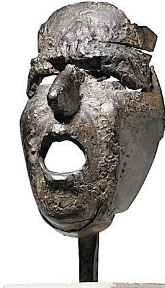
Julio González. Máscara de Montserrat gritando (1939). Bronce fundido, 32,8 × 14,9 × 12 cm.

Observe la siguiente imagen. Fíjese también en el año y el título.