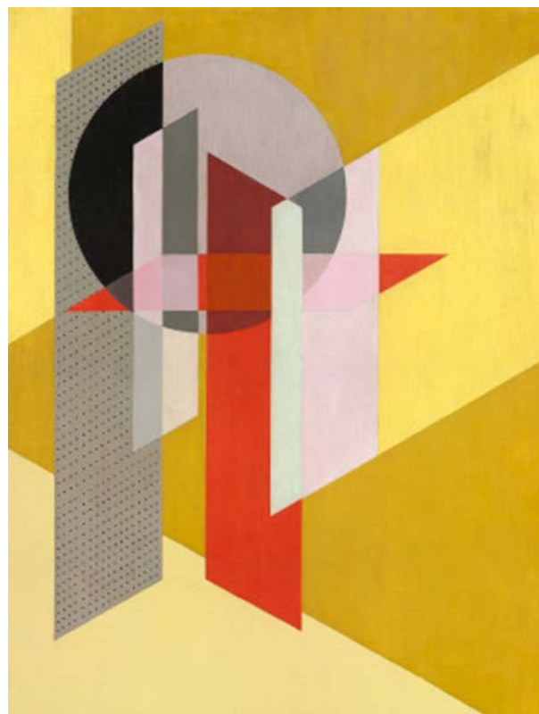
László Moholy-Nagy. Z VII (1926). Pintura al óleo de la serie «Z».