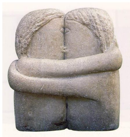
4B. C. Brancusi: El Beso . 1908.