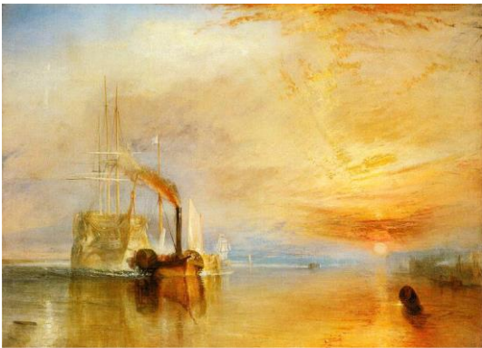
3A. W. Turner: El Temerario remolcado para desguace . 1839.