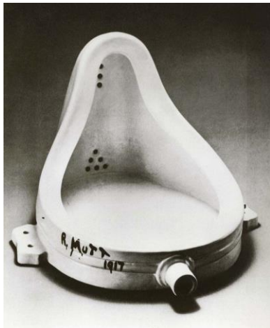
4A. M. Duchamp: La fuente . 1917.