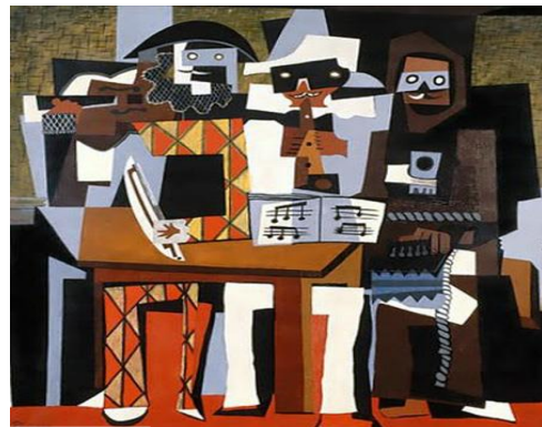
3B. P. Picasso: Tres músicos . 1921.