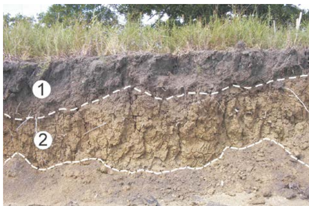
Figura 1. Perfil del suelo H.

En la figura 1 se muestra el perfil de un suelo (H) existente en una terraza fluvial de un río que, aguas arriba, atraviesa una región donde existen importantes yacimientos minerales de sulfuros metálicos. En la tabla 1 se muestran los contenidos (en miligramos por kilogramo de suelo, mg/kg) de algunos elementos químicos del suelo de la fotografía (Suelo H), así como los contenidos en esos mismos elementos en otro suelo muy alejado del cauce fluvial (Suelo J).