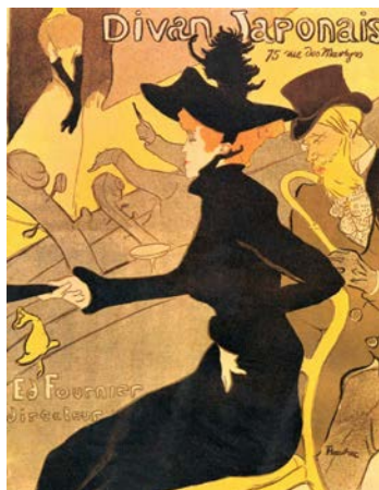
2A. Toulouse-Lautrec: Diván japonés (1893).