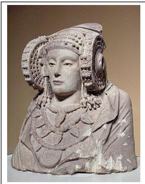
Dama de Elche. S.IV-V a. C.