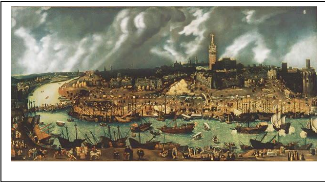
Alonso Sánchez Coello. El puerto de Sevilla . (1576-1600)