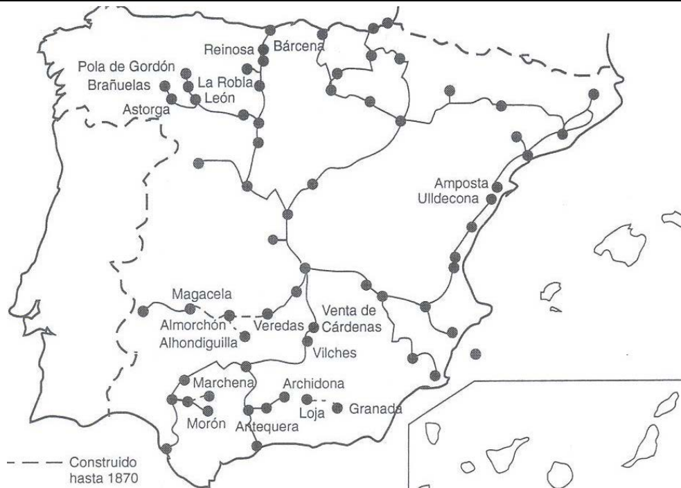
Mapa de los ferrocarriles españoles hasta 1870.

* A partir de sus conocimientos y del material adjunto desarrolle el tema: Transformaciones económicas y cambios sociales en el siglo XIX (Desamortizaciones / Industrialización y modernización de las infraestructuras / Crecimiento demográfico y cambio social. El movimiento obrero). Valoración máxima: 6 puntos.