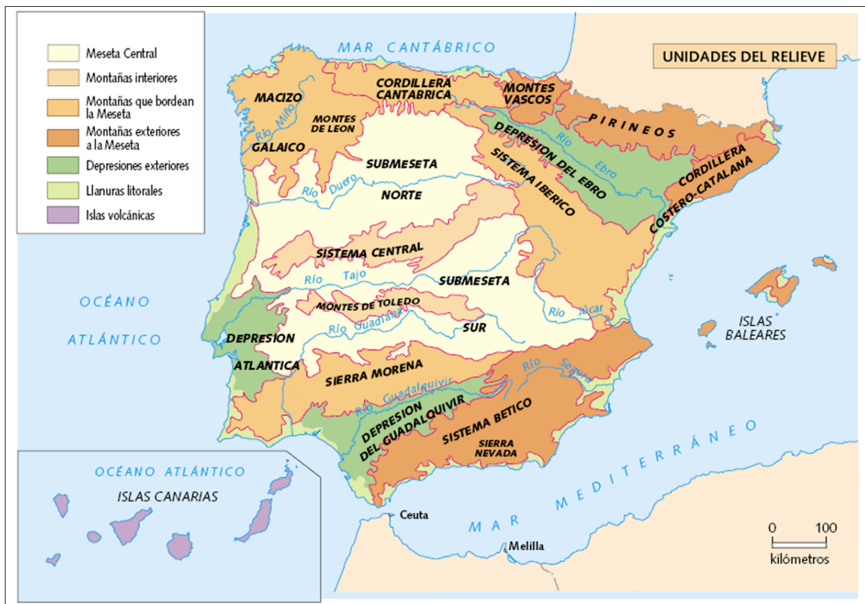
Figura 1: Unidades de relieve

2. Desarrolle el siguiente tema (máximo 600 palabras o 3 caras de folio): las ciudades españolas.